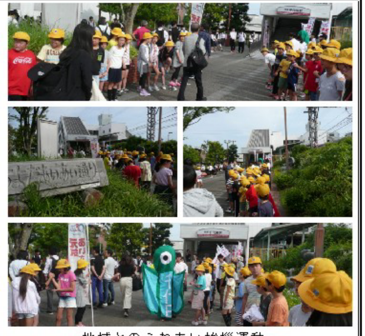
地域とのふれあい挨拶運動

●学校体力向上委員会 授業の補助（家庭科実習等）↓指導のための人材確保に向けた取り組みが必要 ●放課後学習（2、3年）の補助（地域人材の充実）、内容の充実 漢字検定（2月8日（土））・算数検定（1月18日（土））の実施