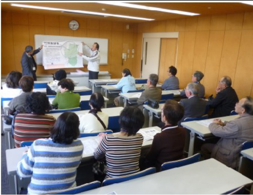
楠小学校区福祉委員会 研修会（2015年 社協パワポより）

子育て支援活動 子育て中の親子などが集まり、ボランティアとともに遊びを通して子どもたちの成長について学習したり、子育てについての交流活動、相談活動などを行います。