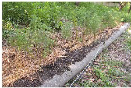
コスモス山（秋を待ちます）

教育委員会が、学校運営協議会の委員を任命し左記の権限を付与します ●校長の作成する学校運営の基本方針を承認する（必須） ●学校運営について、教育委員会又は校長に意見を出すことができる ●（任意） ●教職員の任用に関し、教育委員会に意見を出すことができる 今年度の学校運営協議会は5月30日（木）に開催され、16名の協議委員を選出しました。 今年度の取組み ●つながり委員会 ●地域とのふれあい挨拶運動 ●見守り隊（登下校サポート隊）の充実 ●地域人材バンクの充実 ●学校教育活動へのサポート