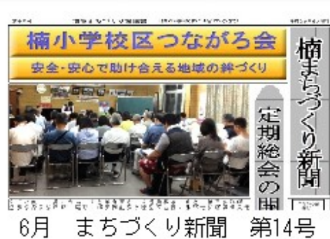
6月 まちづくり新聞 第14号