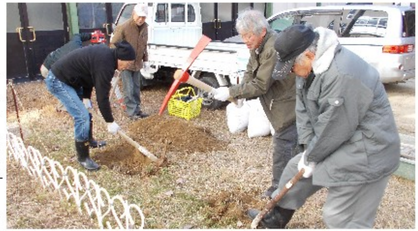
2月7日（水）基礎工事（楠小学校）

年々までに資材の発注を終え、年明けから設置作業に取り掛かりました。全て自分たちの手で進めるということで、木枠型の作成からスタートしました。