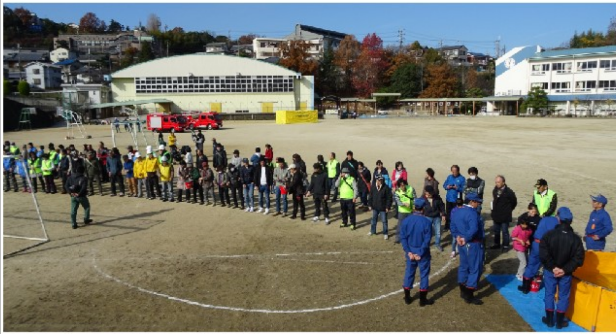
12月3日（日） 防災訓練 楠小学校運動場（バケツリレー）

楠小学校体育館及び運動場にて楠小学校区一斉防災訓練を行いました。250名余の参加があり、避難誘導訓練、避難所開設訓練、情報収集・伝達訓練、炊き出し訓練、応急手当訓練、患者搬送訓練、子ども訓練（消防車乗車体験、水消火器体験、煙体験等々）を行いました。