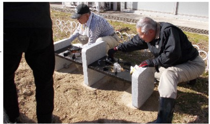
2月27日（火）ベンチ組立（楠小学校）