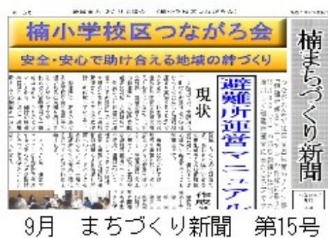
9月 まちづくり新聞 第15号