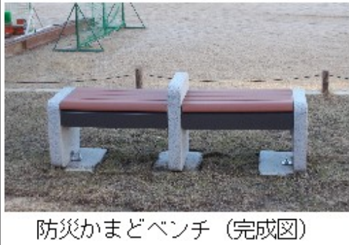
防災かまどベンチ（完成図）

平成30年度 総会案内 6月3日（日） 松ヶ丘集会所 避難所運営マニュアルと様式集をセットで差し上げます