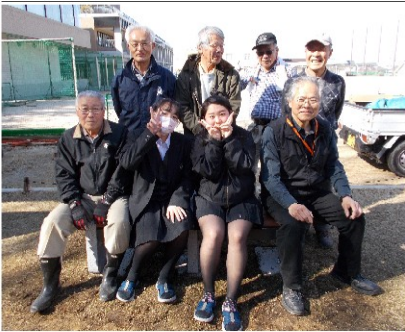
2月27日（火）強度試験（大阪暁光高校）

同日に楠小学校と大阪暁光高校で行いました。同じ日に双方の組み立てを完了させて工事は無事完了となりました。直ぐに複数人