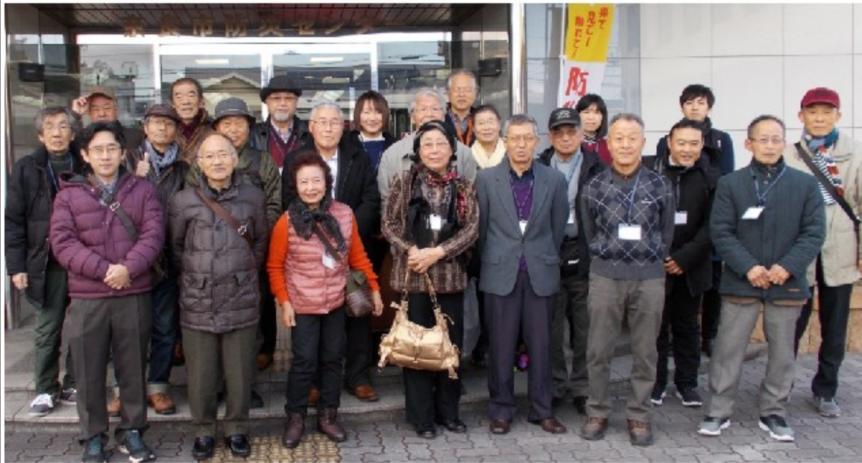
2月4日（日） 奈良市防災センター 研修参加の皆さん

楠小学校区つながる会（まちづくり協議会）では、今年も見学研修として、24名の方が奈良市防災センターを訪問し、知識の吸収に努めました。奈良市防災センターでは消火体験、地震体験、煙避難体験や台風体験を行いました。