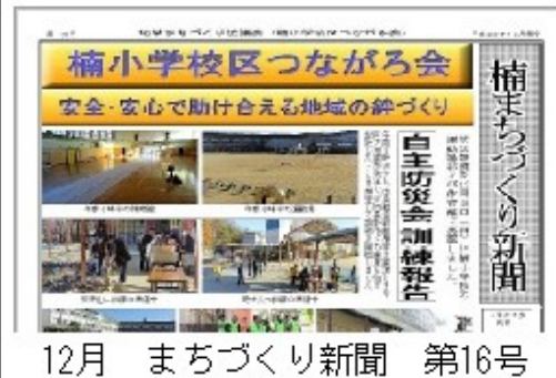
12月 まちづくり新聞 第16号