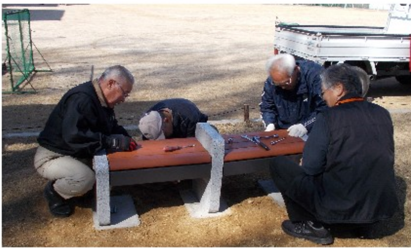
2月27日（火）ベンチ組立（大阪暁光高校）