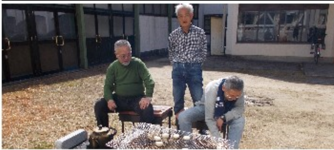
3月4日（日）運用テスト