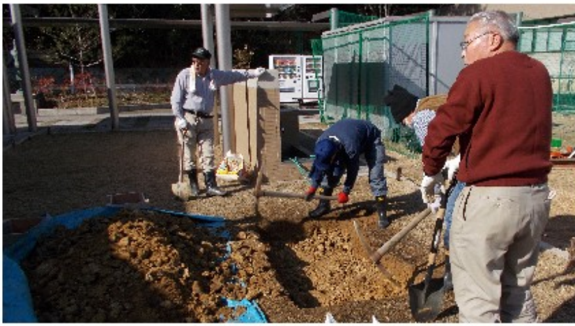
2月16日（金）基礎工事（大阪暁光高校）

2月に入り、楠小学校中庭の整地作業を開始しました。地中深く穴を掘り木枠型を使ってセメントを流し込み基礎部分を行いました。数日後に大阪暁光高校にも同じく基礎工事を行いました。