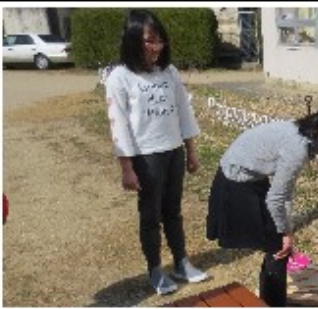
3月4日（日）かまど試運転