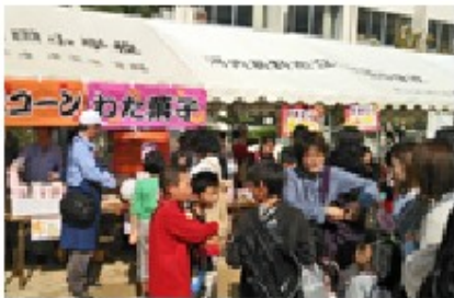
2013年の様子 (千代田中学校区)