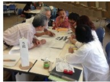
ワークショップ風景

小学校区を単位として、地域の特性を活かした将来のまちづくりについて、地域ごとの計画を策定します。 10年後のめざすべき地域の姿の実現に向け、地域主体で行う取り組みと、それを支える行政の支援策等を考えます。 自由に参加してください。