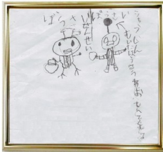
一年生 いけがみくん

夏休みに楠小学校の生徒さん にお願いして防 火元には先ず水を掛けて うこうをおしえてくれる」 の文字が見えます。 左隣の文章は「ぼうさい せんせい」と「ぼうさい ちゅうじん」が「むいたほ うこうをおしえてくれる」 て書いてました。 炎に関するイラストを描い てました。