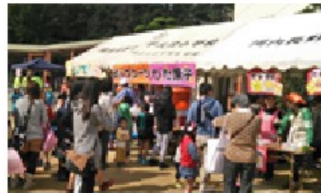
青少年指導員ホームページより