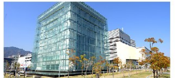
人と防災未来センター 外観

22日(土) 8時20分 かげソファマ(株) 長野工場 集合 防災研修 神戸市中央区