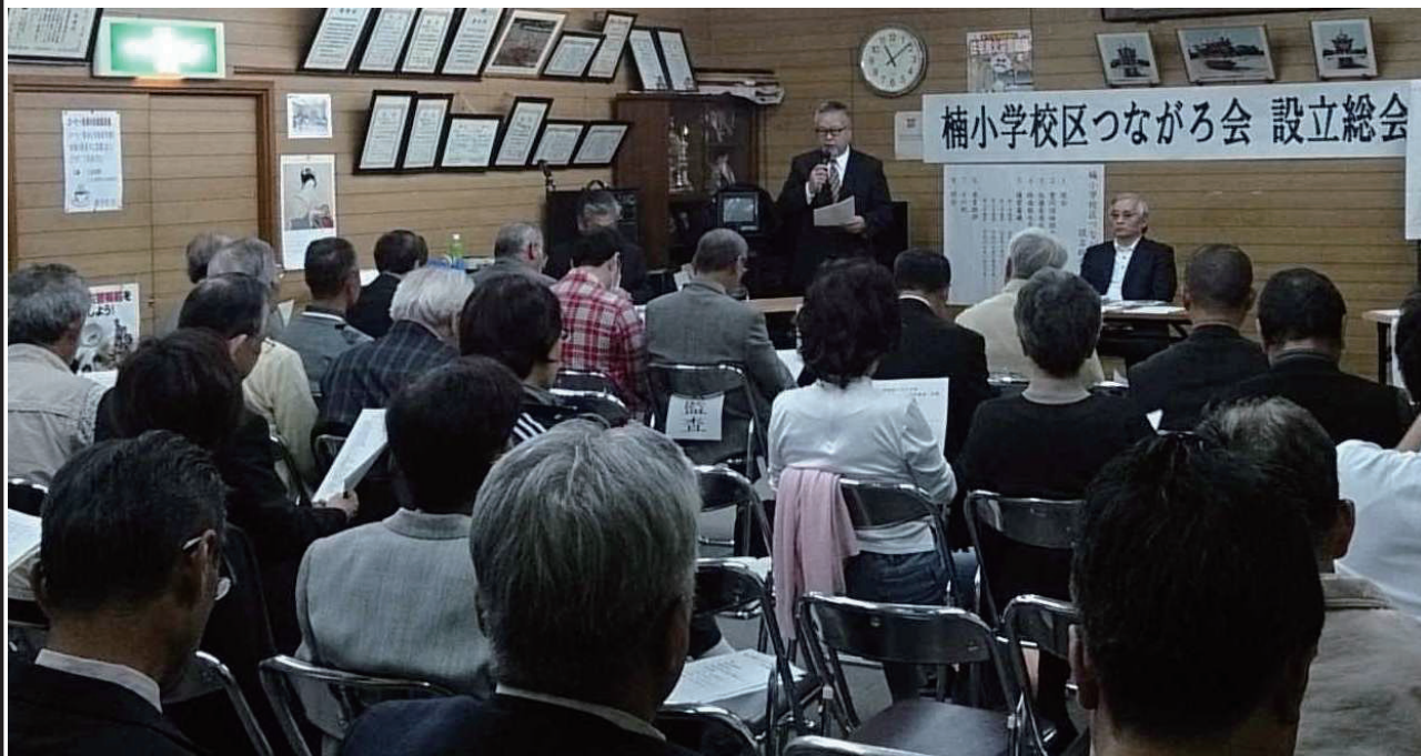
設立総会（松ヶ丘集会所）

平成25年11月4日（月曜日）、松ヶ丘集会所で、設立総会が開催され、市内6つ目となる地域まちづくり協議会「楠小学校区地域まちづくり協議会」が誕生しました。 楠小学校区では、平成24年11月には準備会を設置し、協議会設立に向けて準備を進め、平成25年11月の設立につながりました。