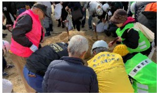
砂場で土のう作成

12月8日に「楠小学校区つながる会」主催の第5回防災訓練が楠小学校の校庭と体育館をお借りして開催されました。訓練開始の合図がある