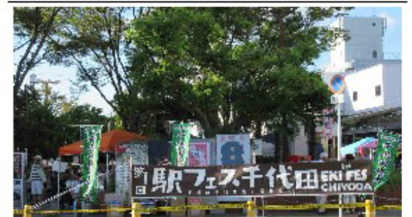
千代田駅 西側広場

9月7日に千代田活性化委員会が主催する「第1回駅フェス千代田」の様相を取材しました。午前中から夕方暗くなるまで、屋台あり、ライブあり、お菓子撒きありの楽しいイベントでした。詳しくは「楠まちづくり新聞 23号」に掲載しました。