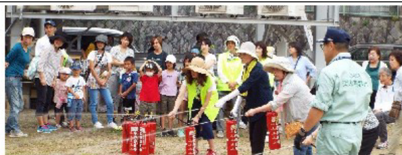
合同防災訓練の様子

12月1日に「ライオンズマンション千代田」で消防・防災訓練が開催されました。消防署の協力を得て、代表者が「はしご車」に