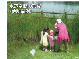
水辺空間の形成(他所事例)

市街化が進むと緑や水辺空間が減ってしまいますが、ため池周辺は緑もあり、水に親しむことのできる憩いの空間となります。生き物の生息場所にもなります。