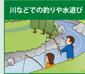
川などでの釣りや水遊び

局地的大雨(いわゆる“ゲリラ豪雨”)は総雨量は少なくとも、十数分で甚大な被害が発生することがあります。