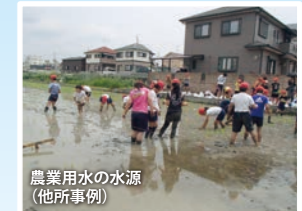
農業用水の水源(他所事例)