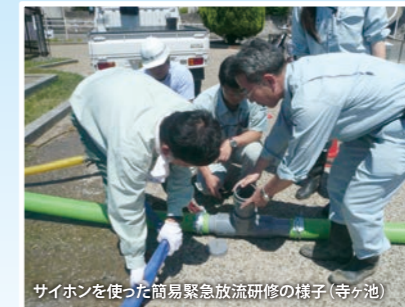
サイホンを使った簡易緊急放流研修の様子(寺ヶ池)

水の確保が難しい地域では、古くからため池を活用し、農業用水として利用しています。貴重な水源です。