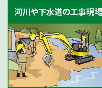
河川や下水道の工事現場

もし、このような場所にいたら… 天気の急変に注意し、危険を感じたらすぐに身の安全を図ってください!