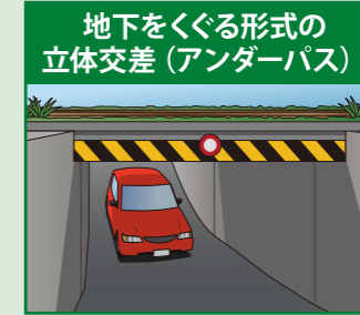
地下をくぐる形式の立体交差(アンダーパス)