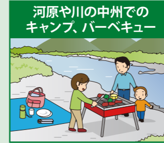
河原や川の中州でのキャンプ、バーベキュー